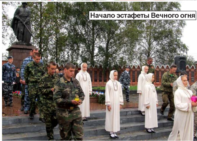
Начало эстафеты Вечного огня