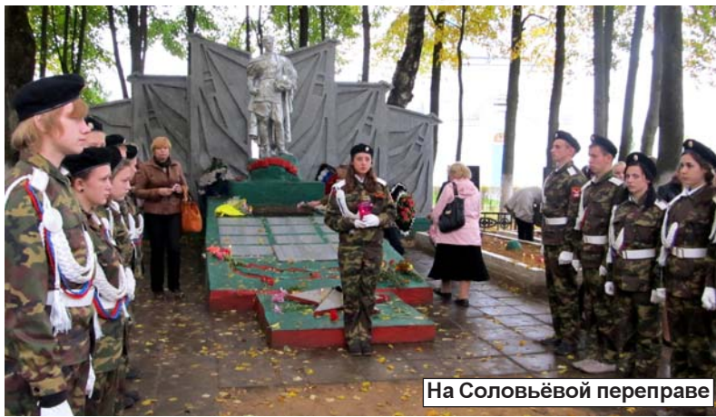
На Соловьёвой переправе