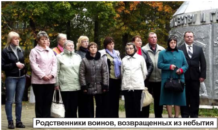
Родственники воинов, возвращенных из небытия