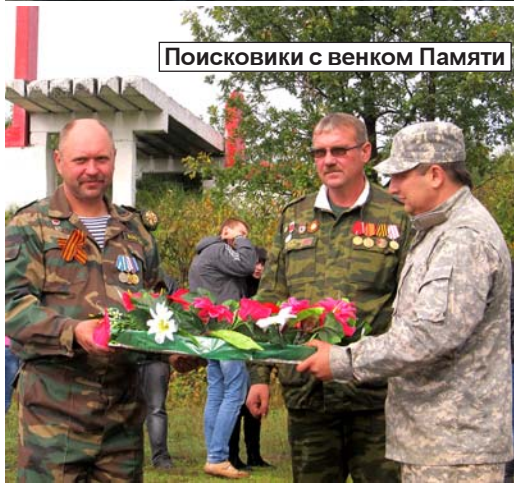
Поисковики с венком Памяти