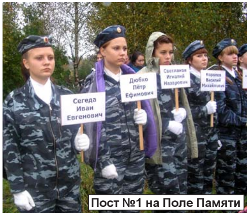
Пост №1 на Поле Памяти