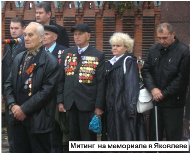
Митинг на мемориале в Яковлево